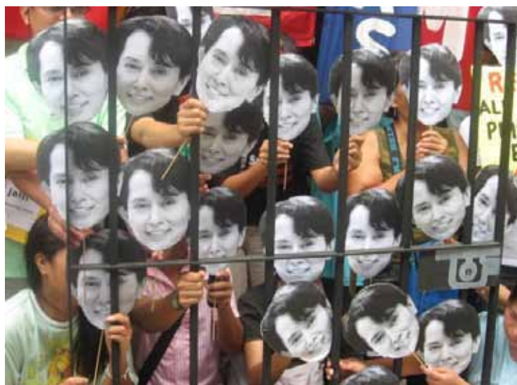
Las compañeras de la MMM-Filipinas protestan en contra a la más reciente pena de arresto (domiciliar) de Daw Aung San Suu Kyi en Burma

Daw Aung San Suu Kyi de Birmania acaba de ser sentenciada nuevamente por la junta militar a 13 meses de prisión domiciliaria. Antes de su sentencia, activistas de la Marcha Mundial de las Mujeres de Filipinas, lideradas por la Coalición contra el Tráfico de Mujeres - de Asia Pacífico (CATW-AP), la Alianza Laborista Progresista - Mujeres (APL - Mujeres) y el Colectivo Birmania Libre, para exigir justicia.